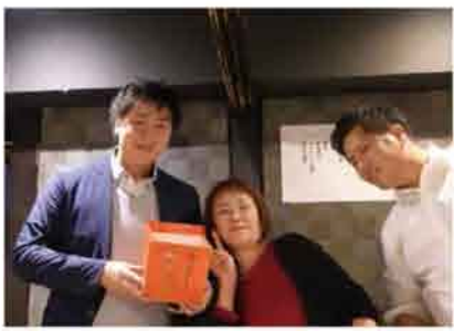
▲2019.12.27 JLB 忘年会